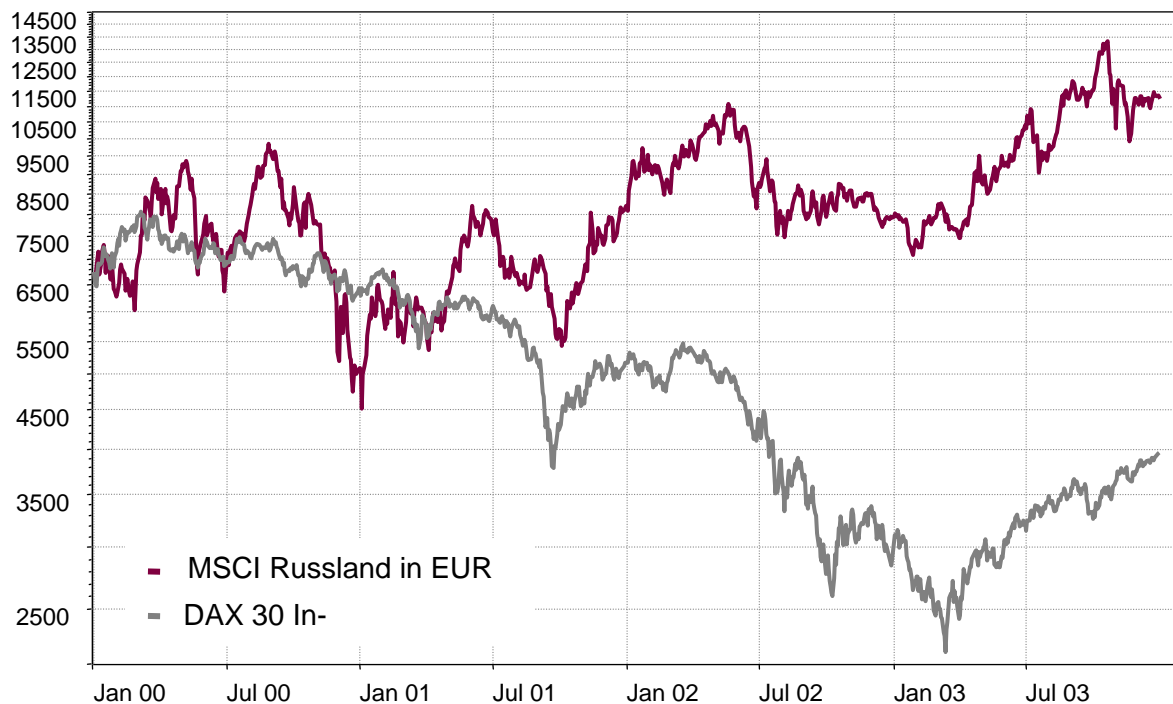
DAX 30 im Vergleich zum MSCI Russland von 2000-2003 in Euro.

Der Grund liegt darin, dass diese in ihrer Wertentwicklung nur gering mit den etablierten Märkten korrelieren. So konnte etwa in den Jahren 2000 bis 2003, als es an allen großen Börsen massiv bergab ging, in vielen Schwellenmärkten mit Aktien gutes Geld verdient werden. Ein ausgewogenes Aktien-Mix aus verschiedenen Börsen, Branchen und Bereichen, die in ihrer Wertentwicklung möglichst wenig voneinander abhängen, ist deshalb ein absolutes Muss! Neben den Emerging Markets führen auch Rohstoff- und Goldminentitel und Aktien aus dem Energiebereich (Versorger, Ölwerte) oft ein starkes Eigenleben.