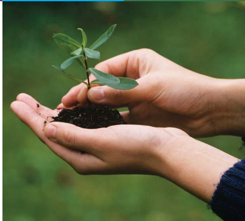
Geschütztes Wachstum der Vorsorge für Selbstständige!