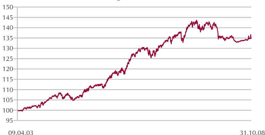
Wertentwicklung seit Auflage (in Fondswährung = Euro, auf 100 indiziert)