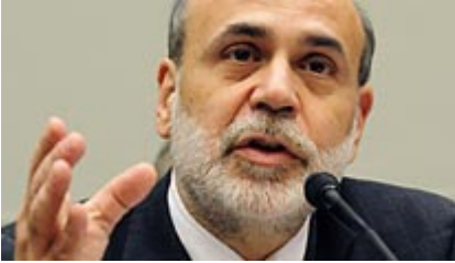
Fed-Chef Ben Bernanke

Erschienen am 17. Dezember 2008 | cs/bab/sky