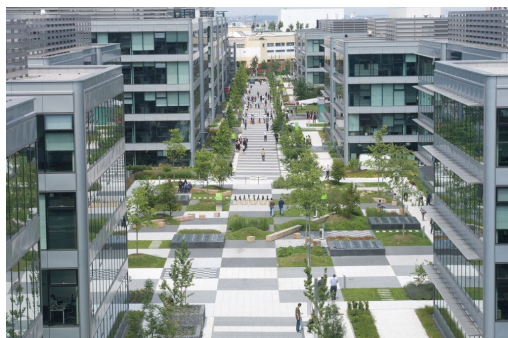
Prags modernster Businesspark „The Park“: Hier wurden für den Fonds vier Gebäude neu erworben.

Das Geschäftsjahr 2007/2008 bis zum 30.9.2008 verlief für den DEGI EUROPA positiv. Die 1-Jahres-Wertentwicklung stieg auf 4,5 % (Vorjahr: 4,1 %). Die Erträge aus den Immobilien und den liquiden Anlagen erlauben eine Ausschüttung in Höhe von 2,9500 Euro pro Anteil. Davon bleiben 10,8 % steuerfrei.