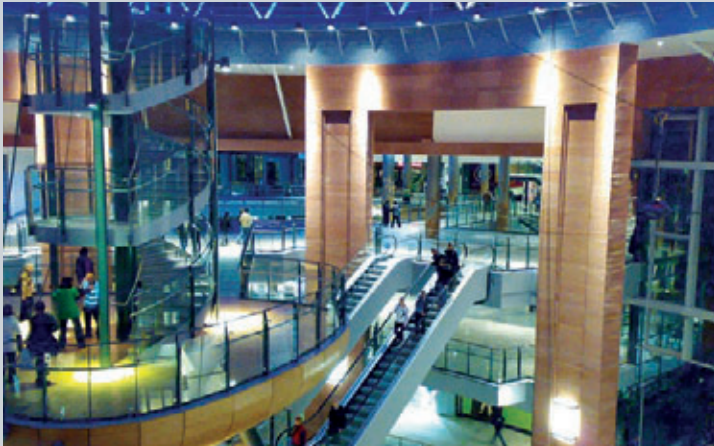
... „Victoria Square“ ...