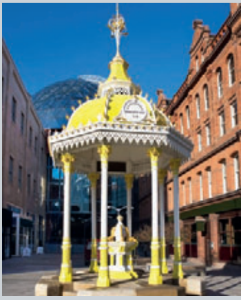
Belfast, Daniel Joseph Jaffe Memorial und ...