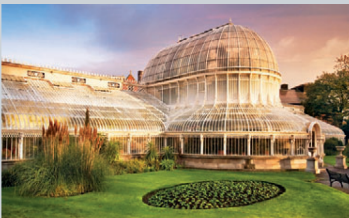
... sowie Botanischer Garten