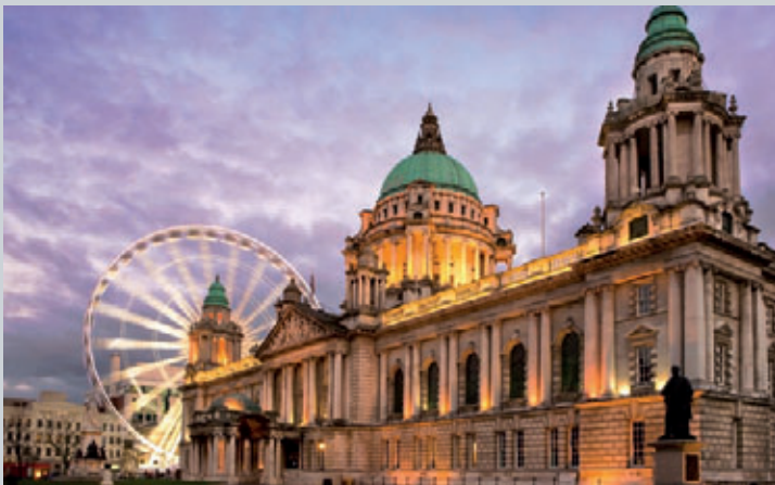
... City Hall ...