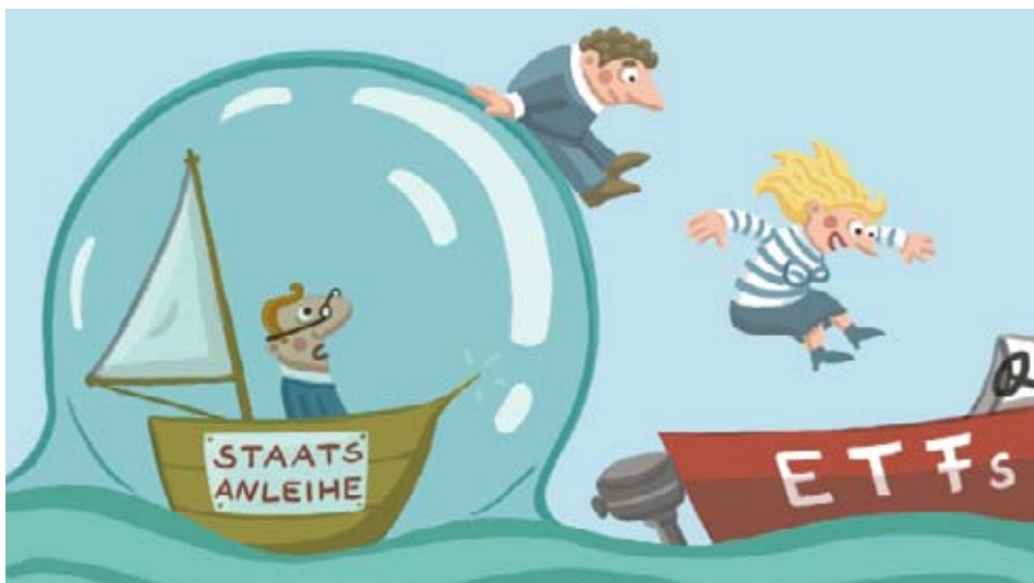
Illustration: Adja Schwietring