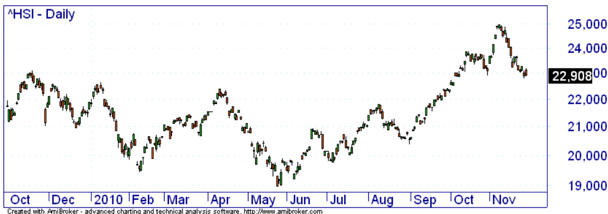
Abbildung 1: Tageschart des hongkonger Leitindex HSI

Wie bei Systemen mit Kapitalverkehrsbeschränkungen üblich, bilden sich Sekundärmärkte über die eine “faire Preisbildung” für die Währungspaare statt findet. In diesen Märkten ist der USD bereits 20 % weniger wert, als offiziell im Währungspaar HKD/USD abgebildet. Der Kauf von HKD und gleichzeitige Verkauf von USD erscheint derzeit risikolos. Der Trade hat eine mittelfristige Ertragsperspektive von mehr als 10 %. Da die erwartete Bewegung abrupt verlaufen wird, ist hier nur ein strategisches Engagement zielführend.