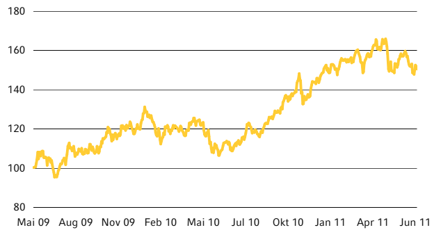
Stand: 30.06.2011

Frühere Wertentwicklungen sind kein verlässlicher Indikator für die künftige Wertentwicklung.